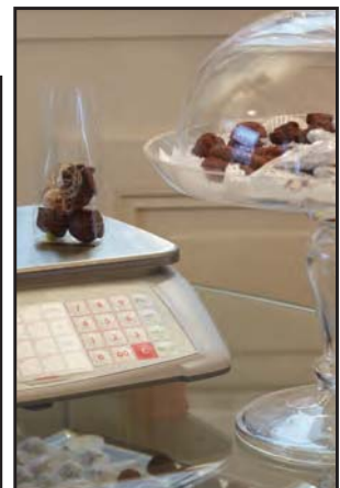
Konfekt, Tee, Schokolade