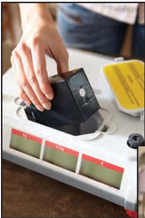
Netzunabhängiger Betrieb dank wiederaufladbarer Akku