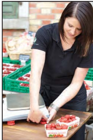
Einfach einstellbare Füße