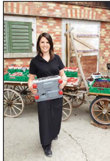
Problemlos zu tragen mit den beiden Griffen seitlich unten an der Waage.