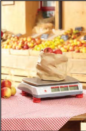
Obst- und Gemüsemärkte

Die Aviator 5000 ist eine elegante, tragbare Handelswaage, die sich für zahlreiche Einsatzgebiete eignet, wie z.B. Wochenmärkte, Verkaufsstände oder kleinere Fachgeschäfte. Mit ihrem geringen Gewicht, der robusten Konstruktion und der hochwertigen Edelstahlwägeplatte eignet sie sich perfekt für Umgebungen, in denen Lebensmittelhygiene, Tragbarkeit und Robustheit unverzichtbar sind. Zusammen mit der hochwertigen Wägetechnologie ist die Aviator eine Investition in Langlebigkeit und Zuverlässigkeit. Die Arbeit mit der Waage geht schnell und mühelos von der Hand - dank ergonomischer Tastatur und bedienungsfreundlicher Benutzeroberfläche bedienen Sie Ihre Kunden bei allen Anwendungen deutlich schneller.