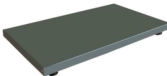
Plattform 150 kg und 300 kg Kapazität,